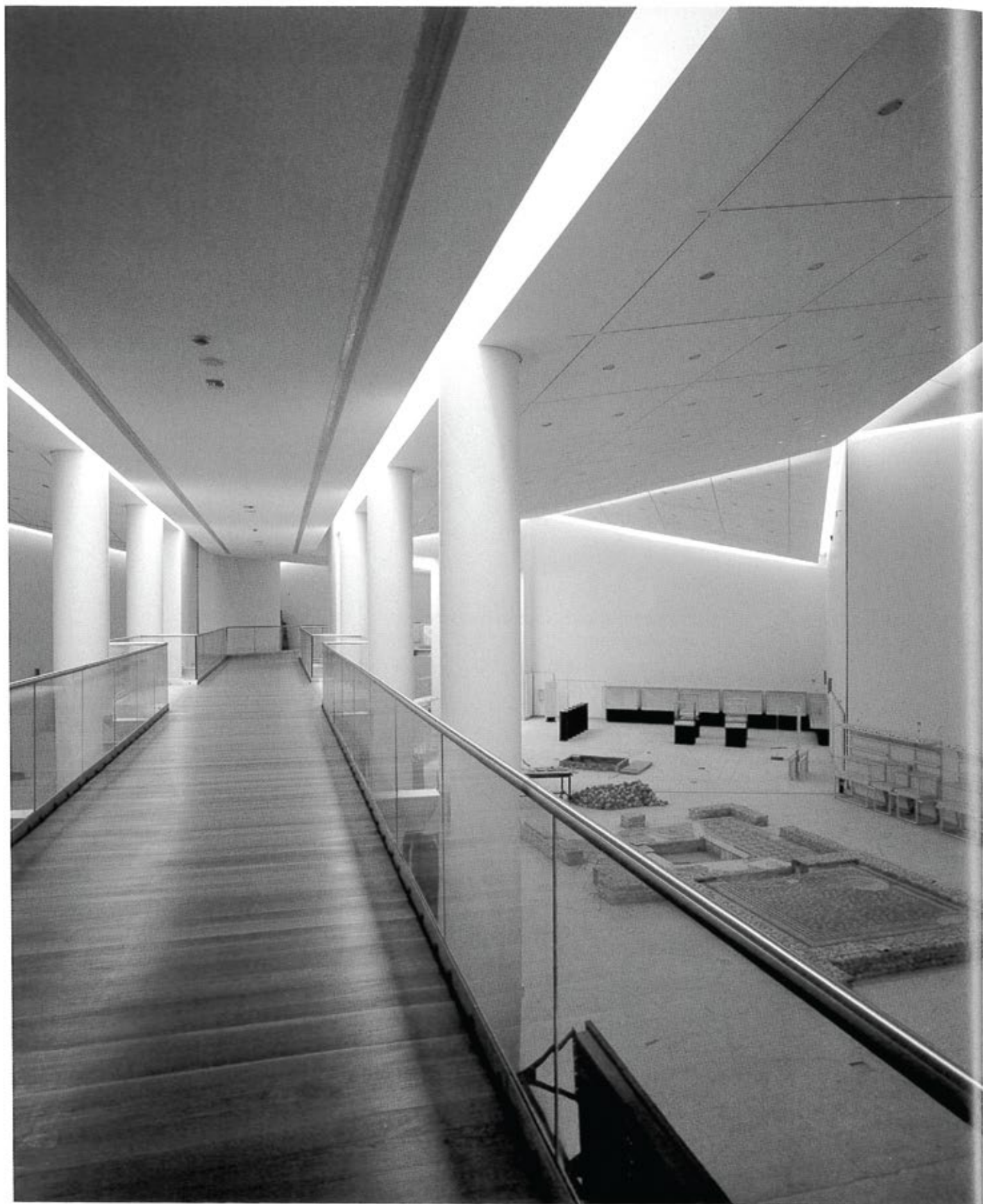
Υπεριψωμένη Πανοραμική μουσειακή διαδρομή μεταξύ των ενότητων ιδιωτικού & δημόσιου βίου