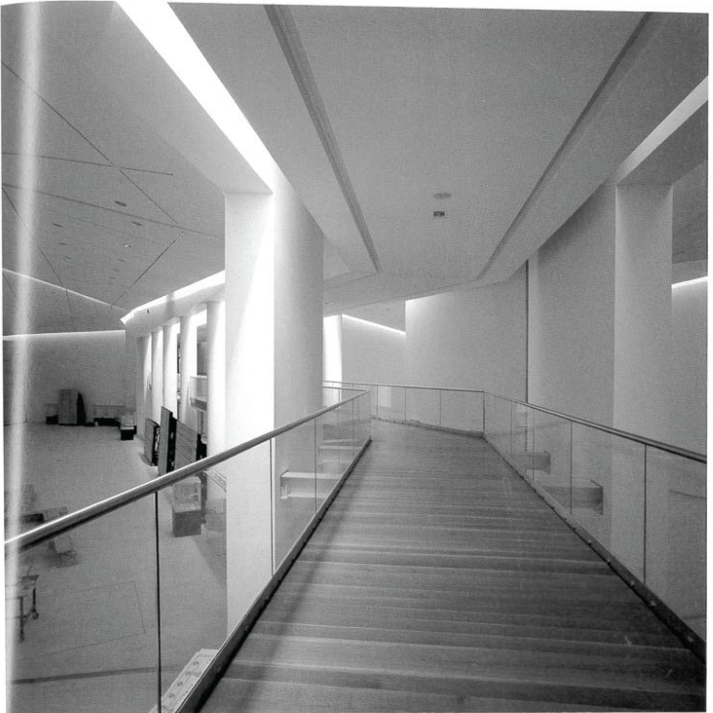
Υπερυψωμένη Πανοραμική Μουσειακή διαδρομή μεταξύ των ενότητων

σμού ήταν η δημιουργία ενός άξονα, εκατέρωθεν του οποίου χωροθετήθηκαν εκθεσιακές αίθουσες, αμφιθέατρο, εργαστήρια και γενικά όλοι οι προβλεπόμενοι χώροι. Ο άξονας αυτός αποτελεί τον βασικό χώρο ευανάγνωστης κυκλοφορίας και εξυπηρέτησης των εκθεσιακών και γενικότερα Μουσειακών αναγκών. Χωρίζει και εννοποιεί τις αίθουσες, αποτελεί από μόνος του εκθεσιακό χώρο σύντομης εκθεσιακής διαδρομής, εξυπηρετεί τις ανάγκες μετακίνησης των εκθεμάτων και άλλων στοιχείων από τις αίθουσες στα εργαστήρια και αντίστροφα. Διατρέχει όλο το μήκος του Μουσείου, συνιστά τη ραχοκοκαλιά του κτιρίου και συνδέει όλους ανεξαιρέτως τους χώρους. Με κατεύθυνση παράλληλη της πρώην Εθνικής Οδού Πατρών-Αθηνών, η τετλασμένη του ανάπτυξη, αποτελεί έναν