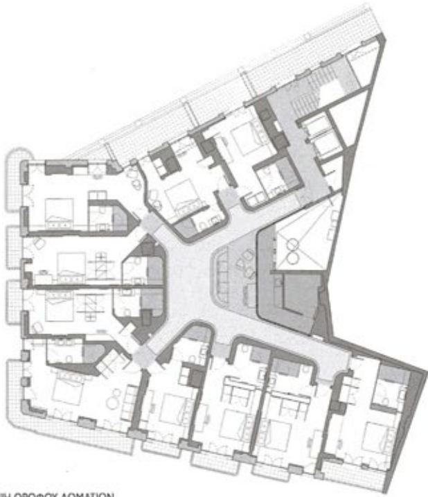
ΚΑΤΩΦΗ ΟΡΟΦΟΥ ΔΩΜΑΤΙΩΝ