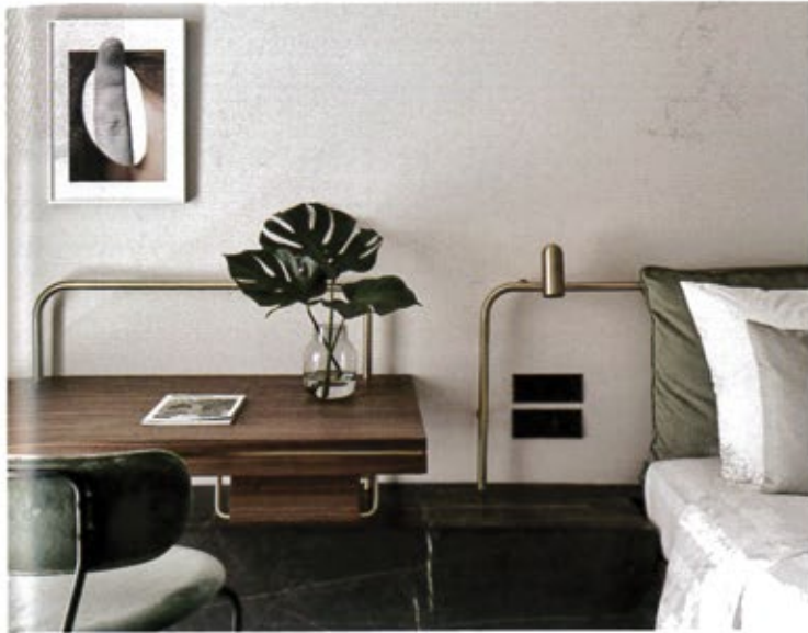
ΤΑ ΔΕΡΑ ΣΤΟΙΧΕΙΑ, ΠΟΥ ΠΑΡΑΠΕΜΠΟΥΝ ΣΤΗ ΒΟΡΕΙΑ ΕΥΡΩΠΗ, ΣΥΝΤΑΙΡΙΑΖΟΝΤΑΙ ΜΕ ΠΙΟ "ΖΕΣΤΑ" ΥΛΙΚΑ ΚΑΙ ΥΦΕΣ.