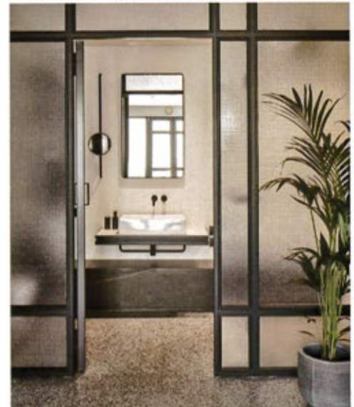
ΤΑ ΛΟΥΤΡΑ ΔΙΑΜΟΡΦΩΘΗΚΑΝ ΜΕ ΒΙΟΜΗΧΑΝΙΚΗ ΑΙΣΘΗΤΙΚΗ ΚΑΙ ΥΛΙΚΑ ΠΟΥ ΠΑΡΑΠΕΜΠΟΥΝ ΣΤΟ ΝΕΟ ΜΟΝΤΕΡΝΟ ΧΑΡΑΚΤΗΡΑ ΤΟΥ ΚΤΙΡΙΟΥ.

χώρων. Ο σχεδιασμός εσωτερικών χώρων αντλεί άμεση έμπνευση από τις καμπύλες και τα επαναλαμβανόμενα μοτίβα των όψεων και των κιγκλιδωμάτων στους εξώστες. Η παραδοσιακή επεξεργασία της πρόσοψης του κτιρίου εισάγεται στους τοίχους των δωμάτων με στόχο τη μεταφορά της ιδιαίτερης ταυτότητας στο εσωτερικό. Το χαρακτηριστικό γκρι χρώμα του λαξευτού επιχρίσματος αποτελεί αφορμή για την επιλογή της παλέτας χρωμάτων και υλικών. Το μωσαϊκό δάπεδο δημιουργεί μια ανάλαφρη ατμόσφαιρα, η αμερικανική καρυδιά προσδίδει μια αίσθηση ζεστασιάς και το βελούδο στα υφάσματα επίπλωσης προσδίδει ένα στιλ πολυτέλειας. Αυτές οι επιλογές συνδυάζονται με τολμηρά μινιμαλιστικά στοιχεία επίπλωσης και ειδικές μπρούτζινες κατασκευές.