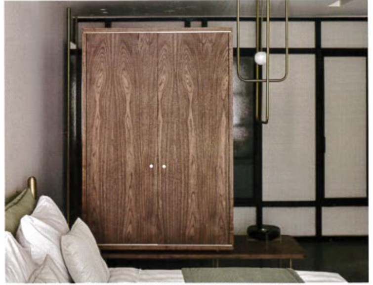
ΤΑ ΔΩΜΑΤΙΑ ΕΙΝΑΙ ΕΥΡΥΧΩΡΑ, ΜΕ ΕΥΡΗΜΑΤΙΚΕΣ ΛΥΣΕΙΣ ΤΩΝ ΑΠΟΘΗΚΕΥΤΙΚΩΝ ΧΩΡΩΝ.