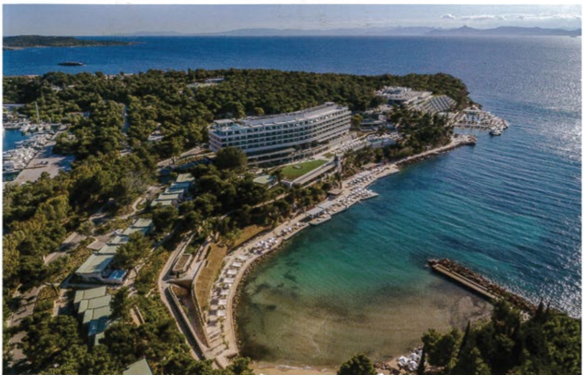
ΠΑΝΟΡΑΜΙΚΗ ΦΩΤΟΓΡΑΦΙΑ ΤΗΣ ΧΕΡΣΟΝΗΣΟΥ ΤΟΥ ΜΙΚΡΟΥ ΚΑΒΟΥΡΙΟΥ, ΣΤΗΝ ΟΠΟΙΑ ΑΝΑΠΤΥΣΣΕΤΑΙ ΤΟ ΞΕΝΟΔΟΧΕΙΑΚΟ ΣΥΓΚΡΟΤΗΜΑ.