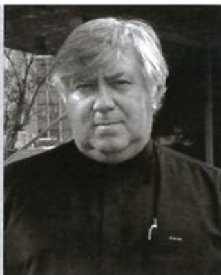
ΧΑΡΡΥ Κ. ΜΠΟΥΓΑΔΕΛΛΗΣ.

ΤΟΠΙΚΟΙ ΣΥΝΤΕΛΕΣΤΕΣ ΕΡΓΟΥ: ΔΙΑΧΕΙΡΙΣΗ ΕΡΓΟΥ: HILL INTERNATIONAL ΑΡΧΙΤΕΚΤΟΝΙΚΗ ΜΕΛΕΤΗ: ΑΕΤΕΡ ARCHITECTS - ΧΑΡΡΥ Κ. ΜΠΟΥΓΑΔΕΛΛΗΣ & ΣΥΝΕΡΓΑΤΕΣ ΑΡΧΙΤΕΚΤΟΝΕΣ Α.Ε. ΣΤΑΤΙΚΗ ΜΕΛΕΤΗ: HELLINIKI MELETITIKI Η/Μ ΜΕΛΕΤΗ: LDK ENGINEERING CONSULTANTS ΔΙΕΘΝΕΙΣ ΣΥΝΤΕΛΕΣΤΕΣ ΑΡΧΙΤΕΚΤΟΝΙΚΗ ΜΕΛΕΤΗ - ΜΕΛΕΤΗ ΕΣΩΤΕΡΙΚΩΝ ΧΩΡΩΝ: MEYER DAVIS STUDIO INC. ΜΕΛΕΤΗ ΤΟΠΙΟΥ: EDSA ΜΕΛΕΤΗ ΧΩΡΩΝ ΕΣΤΙΑΣΗΣ: MARTIN BRUDNIZKI DESIGN STUDIO